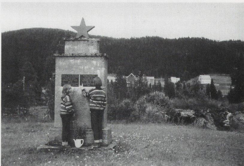
Bautaen som er reist der massegravene lå. Gårdene i Knutlia i bakgrunnen (Foto fra 1993).