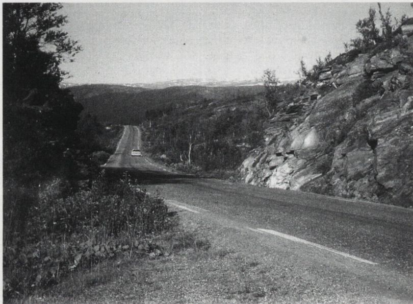
Vegskjæringen der jeg arbeidet i 1944, i dag E6 på Korgenfjellet, sett sydover. (Foto fra 1993).