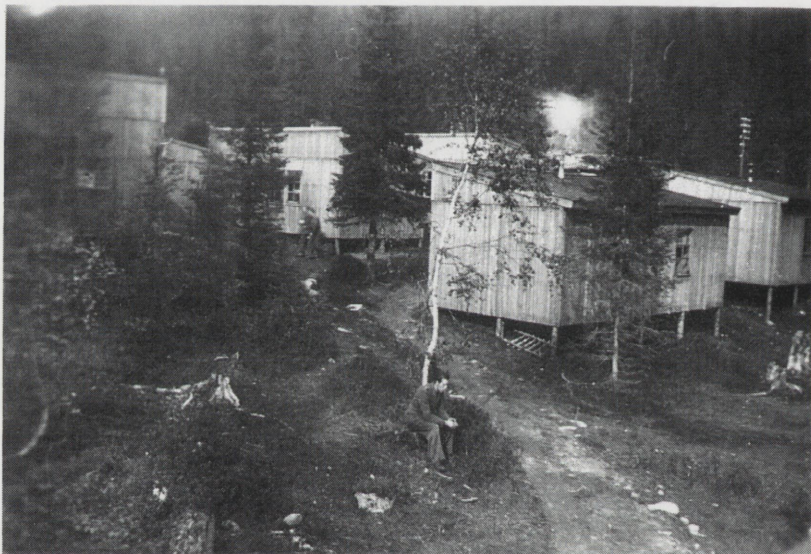
Litt av brakkeleiren. Brakkene vi satte opp var beregnet på 8 mann, vi bodde 16 mann i hver.