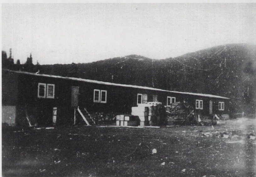
Fangebrakkka i serberleiren, der det tidligere var stuett inn 600 fanger.