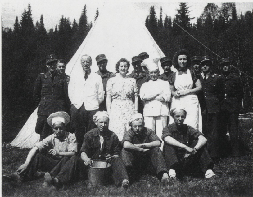
Kokker og befal.