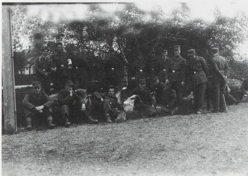
Klar for avreise fra Sparbu stasjon 15. juni 1944.