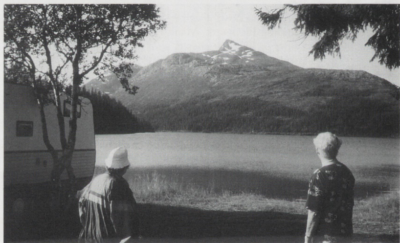
Den 1343 m høge Store Luktind har ikke forandret seg mye fra 1943 (øverst) til 1993 (nederst).