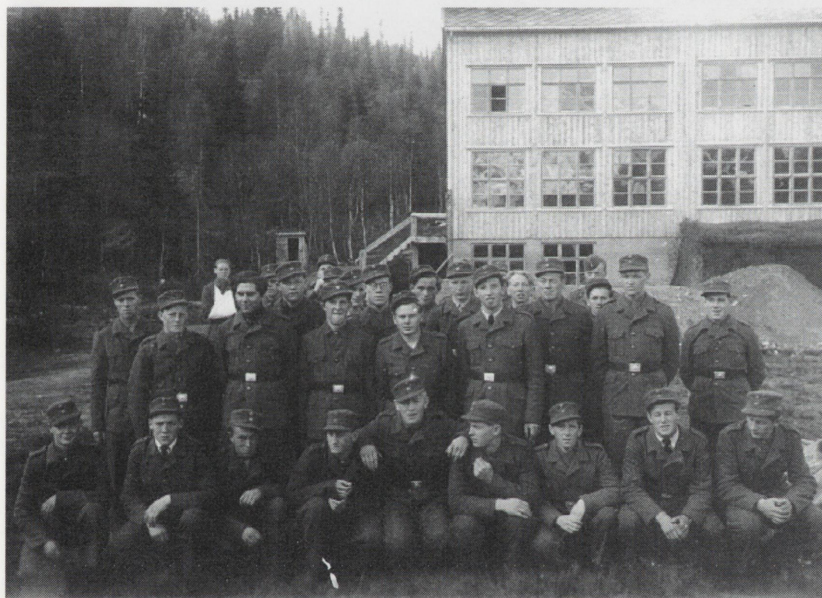
På plass i Osen - endel av mannskapet.