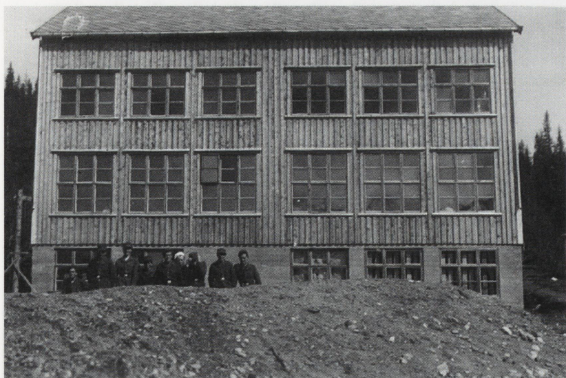
Skoleinternatet som vi hadde som forlegning.